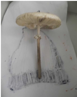
C'est un champignon.