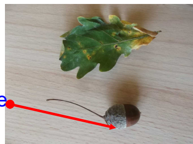
C'est un gland.